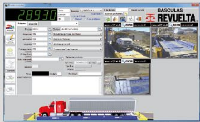
Pantalla de captura de peso con cámaras, Sistema CAI (opcional).

La administración de las tablas, catálogos y operaciones de los diferentes usuarios y/o pesadores están definidos por el Usuario Administrador del Software REVUELTA SIP, el cual es el responsable de otorgar los permisos necesarios según el nivel de confianza de cada uno de ellos.