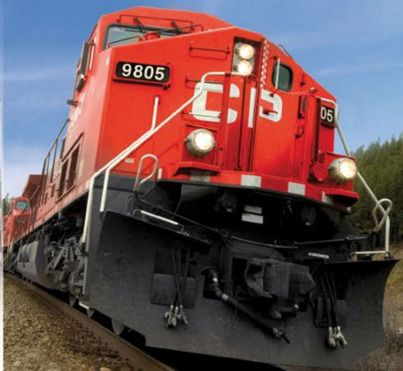
BÁSCULA DE FERROCARRIL