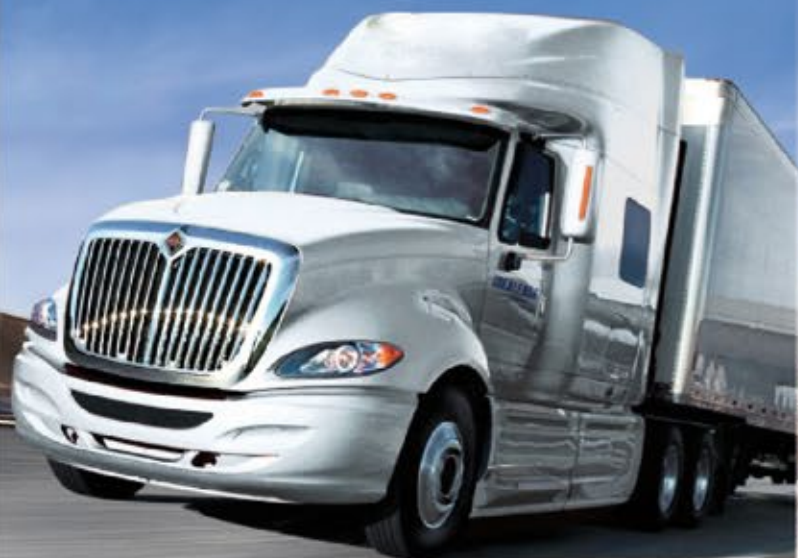
BÁSCULA PARA CAMIONES